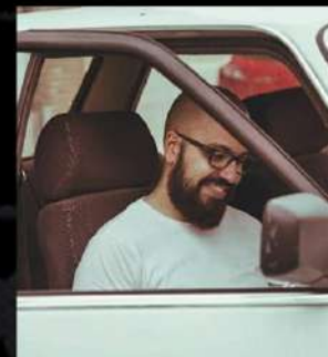
Alfredo Fernández Edición postproducción