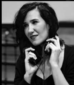
Isabel Royán Compositora