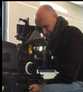
César Hernando Dir. Fotografía